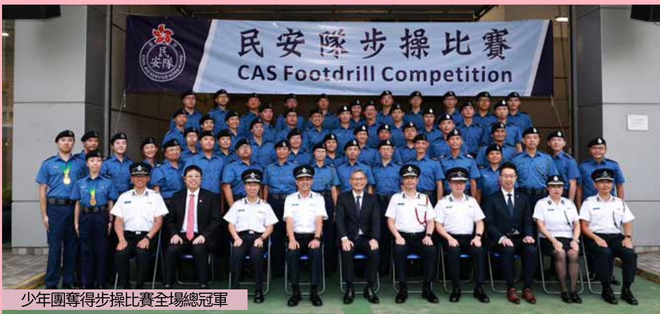
少年團奪得步操比賽全場總冠軍