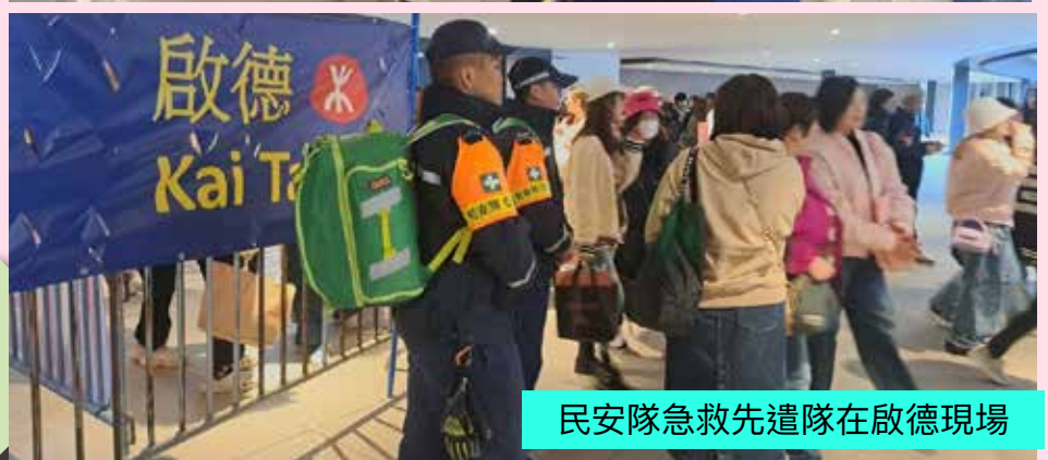
民安隊急救先遣隊在啟德現場

通過這些測試，民安隊成功檢驗了場地及設施在大型活動中的實際運作情況，並為未來正式啟用啟德體育園做好充分準備。所有參與隊員嚴守崗位，以高度紀律和專業精神，確保活動順利進行，展現了民安隊在大型活動中的高效管理能力及跨部門協作精神。