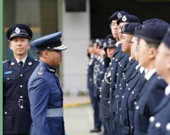
政府飛行服務隊總監胡偉雄機長（左二） 檢閱會操隊伍

胡偉雄機長表示愛國愛港是香港社會的核心精神，亦是「一國兩制」行穩致遠的重要基礎。他鼓勵學員要從經驗中學習，迎難而上、不忘初心、砥礪前行，並深信學員會團結努力，一起茁壯成長，秉承民安隊「救急扶危、服務社會」的精神，竭誠為廣大市民服務。