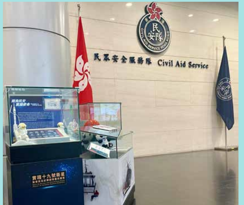
實踐十九號載荷物於民安隊總部大堂展出