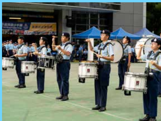
少年團小鼓隊於會操後表演娛賓