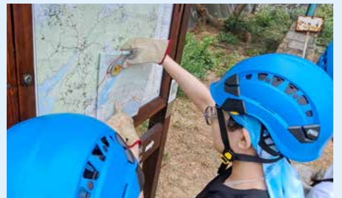
學生運用地圖及指南針完成導師指派的任務