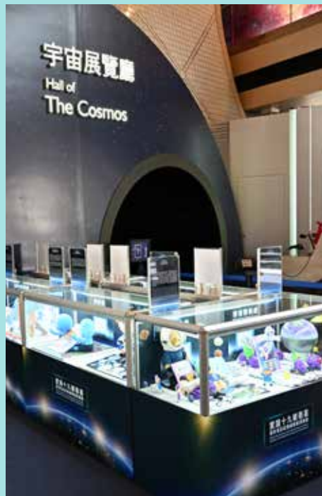
太空館宇宙展覽廳全貌

保安局及轄下紀律部隊和輔助部隊於2024年11月6日在香港太空館大堂舉行了為期六天的展覽，展出早前精心挑選隨衛星升空的文化創意物品，以加強市民的民族自豪感，並增進大眾對各部隊的了解。民安隊載荷物於展覽後繼續在總部大堂展出，與部隊人員分享歷史時刻。