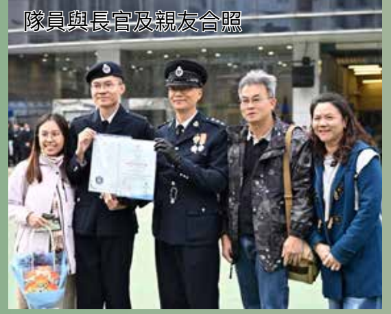
隊員與長官及親友合照