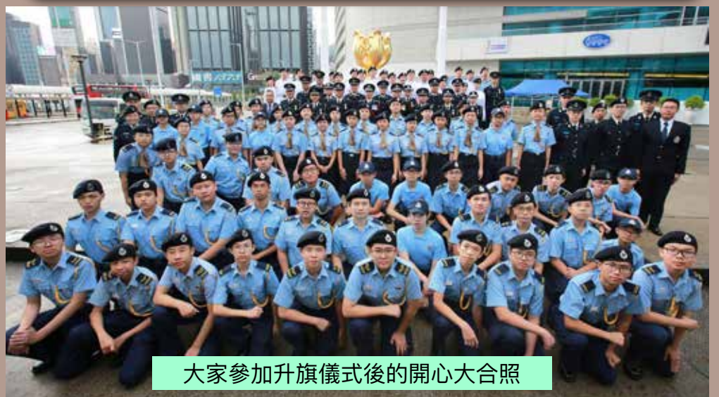
大家參加升旗儀式後的開心大合照