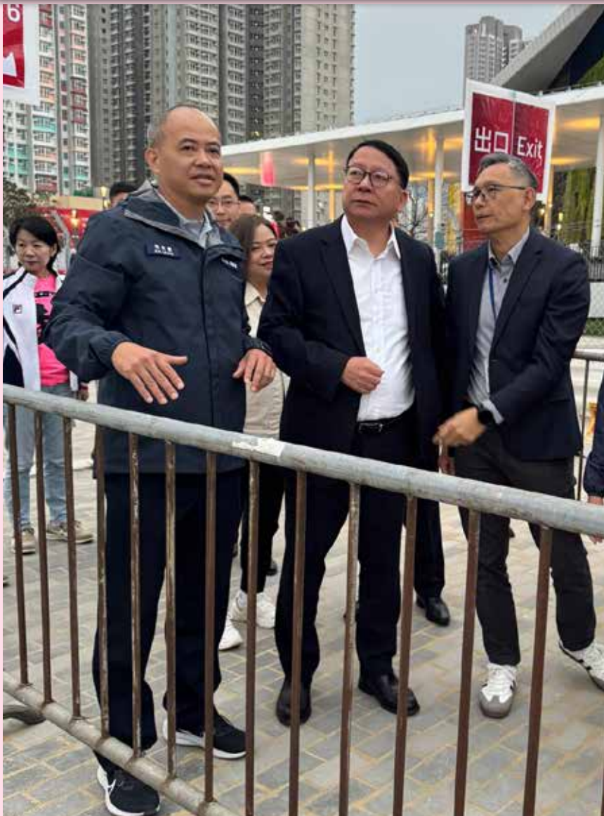
政務司司長陳國基（中）及保安局副局長卓孝業（右）親身到啟德現場視察，並聽取總參事梁冠康（左）講解民安隊的工作情況

啟德體育園 於近月舉行了一系列測試賽活動，旨在檢驗賽事場地安排、設施使用及人流管制等方面的效果。民安隊為此派出大量人手，協助警方進行人群管理工作，確保活動順利及有序地進行。