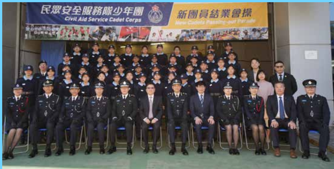
第 145 屆結業團員與檢閱官顧敏康教授（前排左六）與各嘉賓合照