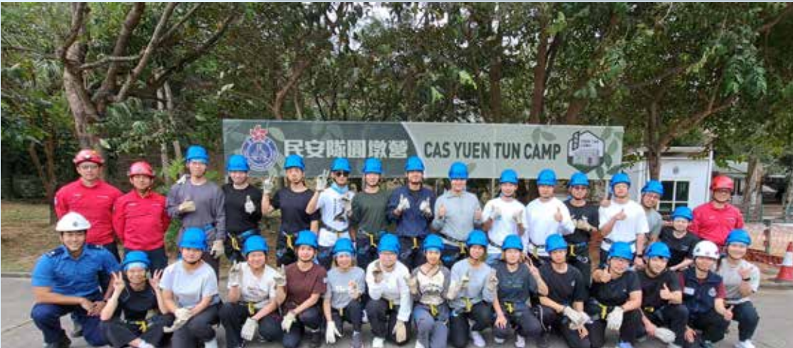
「民盡其才」計劃導師與香港專業進修學校的學生合影留念