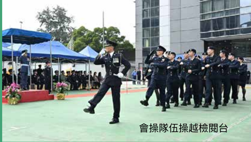
會操隊伍操越檢閱台

民安隊於 2024 年 12 月 15 日在總部舉行第八十九屆新隊員結業會操，由政府飛行服務隊總監胡偉雄機長擔任檢閱官。今屆共有 52 名隊員參與結業會操，當中有來自各行各業的人士。他們將實踐所學的知識和技能，服務社會。胡偉雄機長向優異隊員頒獎，結業學員亦進行搶救技術示範，展示受訓成果。