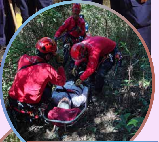
民安隊山嶺搜救中隊人員救助傷者並使用抬床撤離傷者