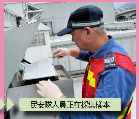
民安隊人員正在採集樣本

收集樣本的地方遍及全港地區，近至市區中心的消防局，遠及沙頭角邊境地區。而根據實際需要，或需在不同時段在同一地點多次收集樣本，因此部隊需要出動全數電單車以配合行動。演習得以順利完成，實有賴民安隊人員的努力。