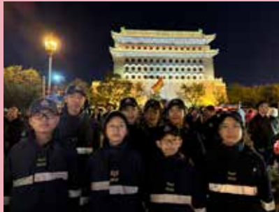
在北京前門大街前合影