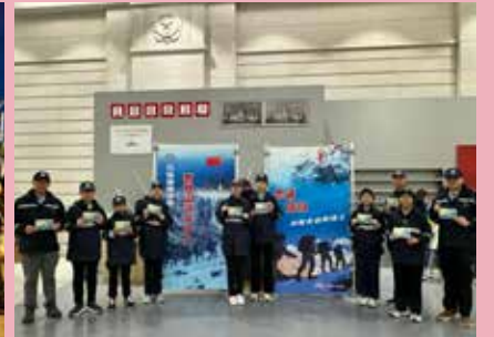
向保衛邊疆的衛士送上祝福