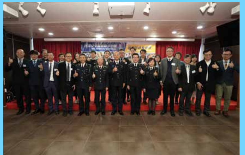
夥伴學校校長及代表老師與高級長官們合照