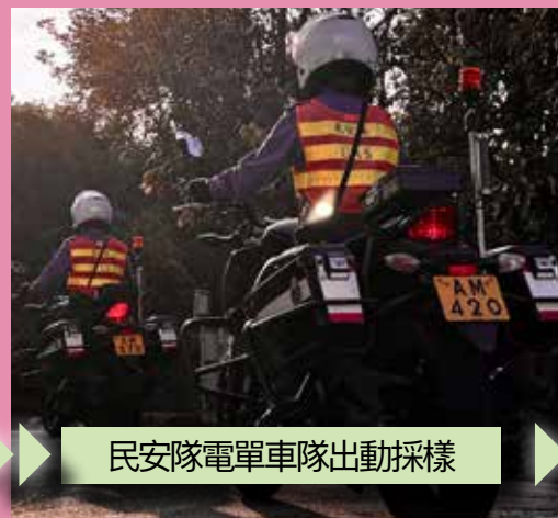
民安隊電單車隊出動採樣