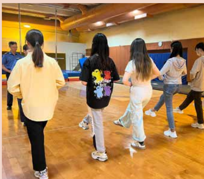
導師以輔助器材助學員掌握正步動作

民安隊在 2024 年 10 月 26 日至 27 日和 11 月 2 日至 3 日透過「民盡其才」計劃向香港教育大學（教大）學生提供升旗及步操進階課程。參與訓練的學生已完成了為期兩天的升旗入門班，為精益求精，現參加由「民盡其才」計劃導師度身訂造的四天升旗及步操進階課程。