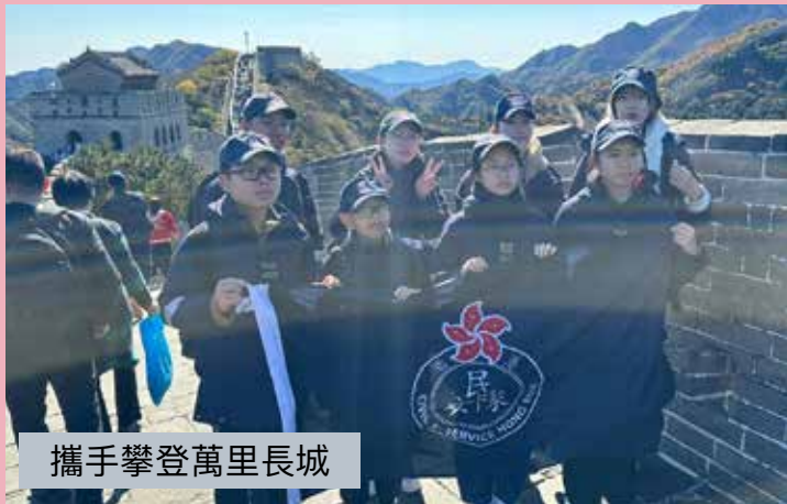
攜手攀登萬里長城

因緣際會，今次成為了帶隊長官，讓我終於有機會踏足國都北京。大學時，有一位來自北京大學的交換生，在他身上，我聽到了北京不少趣事，這時我對北京有了一點期待，希望有一天能親自看看。數年前，我到甘肅和新疆旅遊，想認識一下絲綢之路，原計劃在北京轉機，有數小時的空檔，可以一遊北京，卻因班機延誤，與京城擦身而過。2022 年，部隊推薦我到國家行政學院進修，卻因疫情，課程改在本港上課。今次我終於有機會踏足天安門廣場、踏足八達嶺長城，成為「好漢」。這次旅程十分充實，全是早出晚歸。作為長官，團員的安全和健康遠比景點重要。記得行程第二天，為了準時到達天安門廣場觀看升旗儀式，清晨四時，氣溫只有四度便要出發，我和導師幾乎沒有休息，清早便確保團員已起床及穿了整齊制服及足夠保暖衣物。到達天安門廣場後，靜心等候。雄赳赳的國旗護衛隊不徐不疾地由金水橋以九十七步步伐，整齊一致地正步到達旗台，伴隨着國歌，一聲「向國旗敬禮」，顯示出大國的威嚴，其澎湃和莊嚴，令我不禁感動。