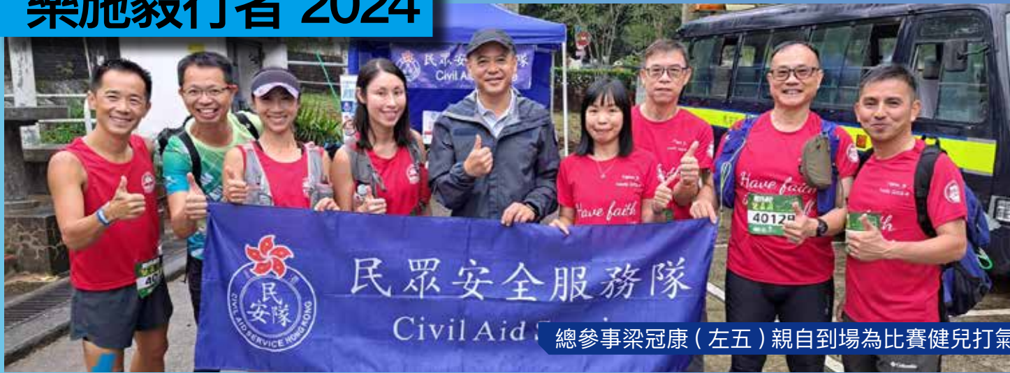
總參事梁冠康（左五）親自到場為比賽健兒打氣

樂施毅行者在 2024 年 11 月 15 至 17 日舉行，路線為西貢北潭涌至屯門哈羅國際學校，全長 100 公里。民安隊於西貢起點及大埔金山郊野公園檢查站協助人群管理工作，以及派出山嶺搜救中隊人員在山上多個地點候命。民安隊於三天活動期間共派出近百名隊員當值，守護毅行者。