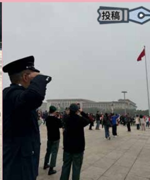
向天安門廣場國旗致敬

下車後，長城的寒風刺骨得可怕，天氣預報說氣溫只有約四度。大家全身上下包裹嚴實，猶如一隻隻企鵝。在導遊的帶領下，「企鵝」們前往搭乘地面纜車登上長城頂部，我們終於見到了毛主席題寫的「不到長城非好漢」。