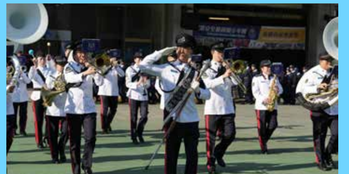
第 145 屆結業會操更請來民安隊樂隊助慶