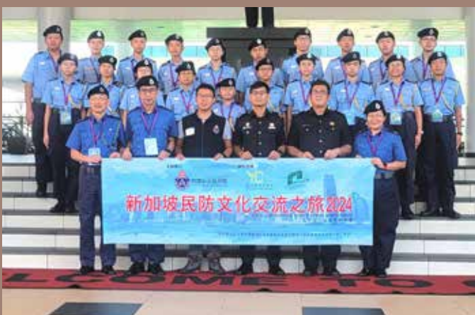
民安隊少年團參觀 Civil Defence Academy

總括來說，這次新加坡民防文化交流之旅不僅讓我增進了專業的防災知識，更拓闊了我們的視野，結識了來自不同背景的朋友。我相信這段經歷將在未來的日子中對我們有深遠的影響，激勵我們日後為國家貢獻自己的力量。希望未來還有更多這樣的機會，讓我們繼續探索世界的美好與多元。