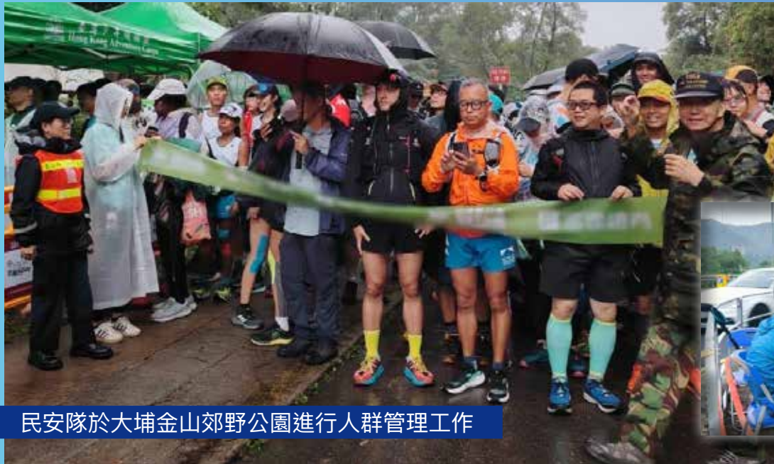
民安隊於大埔金山郊野公園進行人群管理工作

樂施毅行者在 2024 年 11 月 15 至 17 日舉行，路線為西貢北潭涌至屯門哈羅國際學校，全長 100 公里。民安隊於西貢起點及大埔金山郊野公園檢查站協助人群管理工作，以及派出山嶺搜救中隊人員在山上多個地點候命。民安隊於三天活動期間共派出近百名隊員當值，守護毅行者。