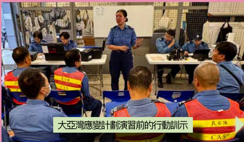
大亞灣應變計劃演習前的行動訓示

2024 年 11 月 17 日，民安隊與天文台舉行大亞灣應變計劃演習。演習模擬大亞灣發生核事故，民安隊派遣電單車傳訊員，到天文台轄下多個監測站及指定消防局收集樣本，並將樣本運送到京士柏輻射實驗室或其他化驗所進行分析。