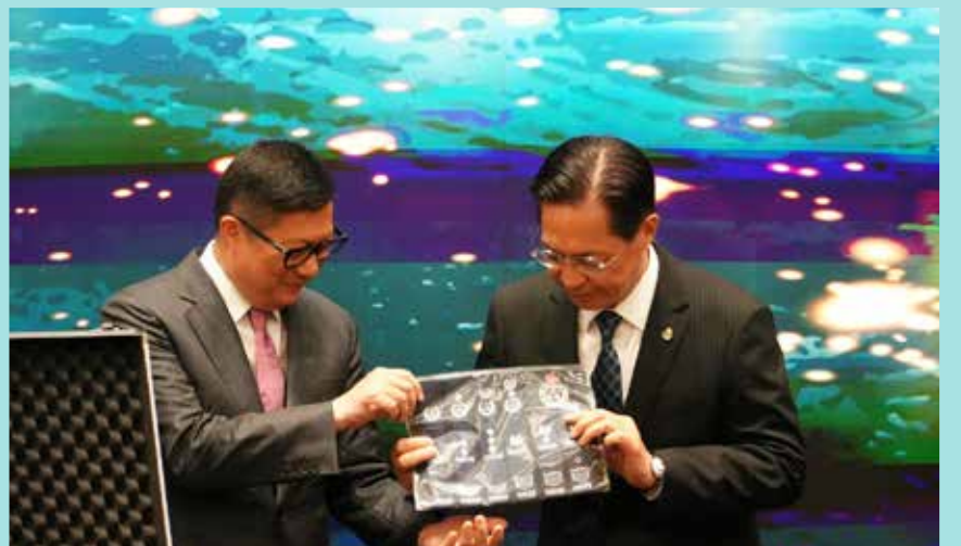
保安局局長鄧炳強（左）將載荷物交予處長羅仁禮（右）

首顆 可重複使用的返回式技術試驗衛星——實踐十九號於2024年9月27日發射升空，並於2024年10月11日成功返航。保安局局長鄧炳強於2024年10月29日在政府總部主持開箱儀式，將載荷物及航天搭載證明交予各部隊首長。民安隊特意挑選了部隊肩章隨衛星升空，象徵全體人員對服務社會的承諾，同時展現民安隊對探索宇宙及追求卓越的渴望。