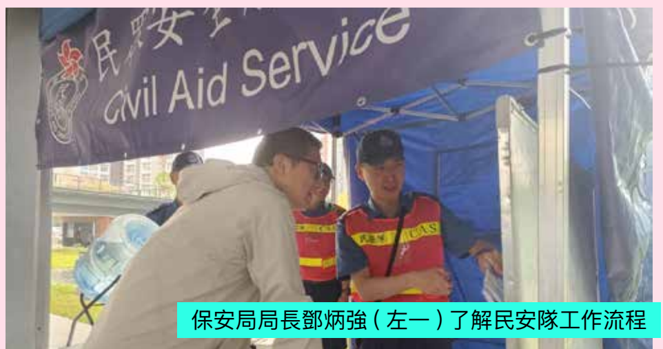
保安局局長鄧炳強（左一）了解民安隊工作流程