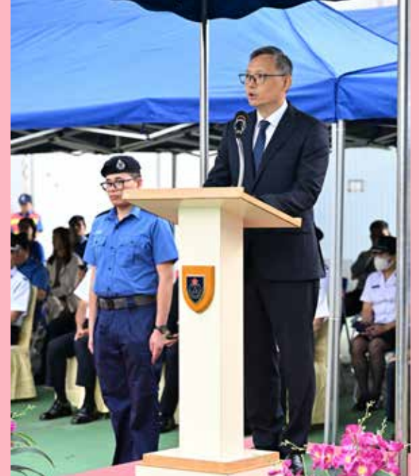
主禮嘉賓保安局副局長卓孝業致辭