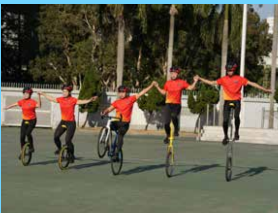
少年團單車隊的表演亦相當吸引