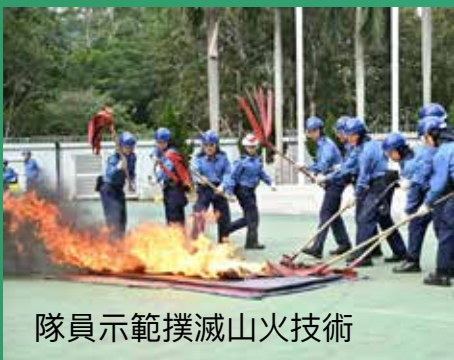
隊員示範撲滅山火技術