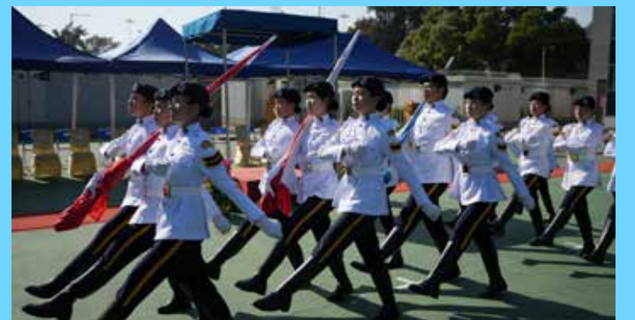
旗隊進場步伐整齊

而在 2024 年 12 月 21 日的第 145 屆新團員結業會操，則邀請到香港教育大學應用政策研究與教育未來學院聯席副院長及國家安全與法律教育研究中心總監顧敏康教授擔任檢閱官。會操開始前，民安隊先在長官會所進行夥伴學校感謝狀頒授儀式，並由民安隊署理副處長（行政）彭穎生及民安隊署理副處長（發展及少年事務）暨高級助理處長（發展）黃江天博士代表民安隊，向 2024-25 年度參與計劃的各夥伴學校校長或代表老師致送感謝狀，感謝各夥伴學校對少年團及夥伴學校計劃的支持。當日共有約 230 名少年團員結業，團員分別來自嘉諾撒培德書院、基督書院、東華三院馮黃鳳亭中學、馬錦明慈善基金馬可賓紀念中學、新會商會中學、獅子會蔣翠琮中學、香港道教聯合會圓玄學院第一中學、以及東涌天主教中學。