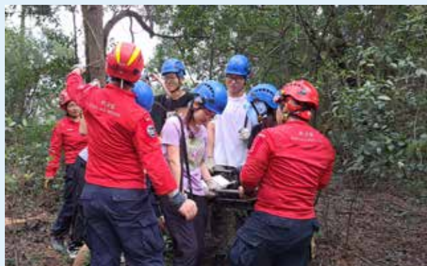
學生在導師指導下，成功把傷者從山坡移至安全區域