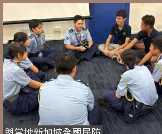
與當地新加坡全國民防青年團團員交流