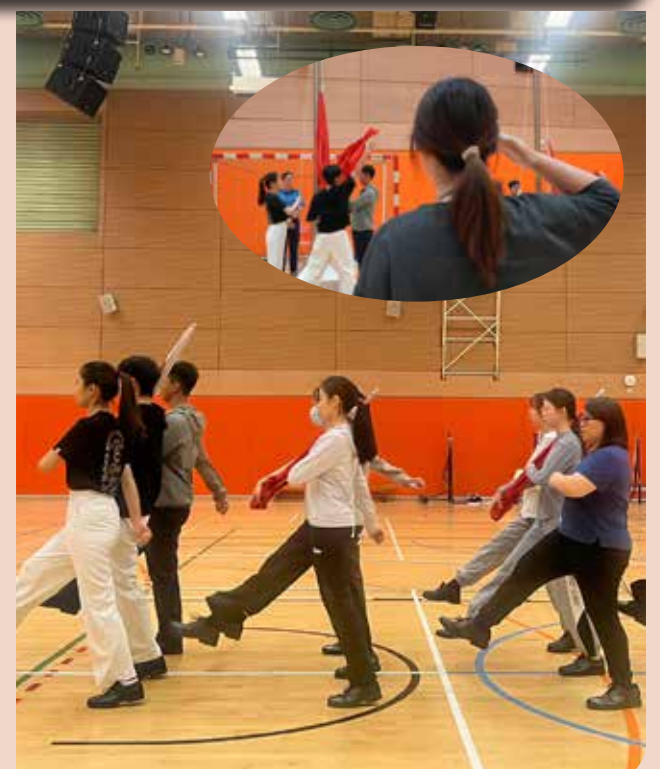
學員展示訓練成果

此次課程不僅提升了學生的技能，更加深了他們對升旗儀式的理解與敬重。我們期待這些充滿熱情的學生能夠在未來的教學生涯中將這份精神發揚光大，為社會培養更多有理想、有擔當的年輕人。