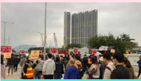
民安隊指示市民乘搭壓力測試的旅遊巴