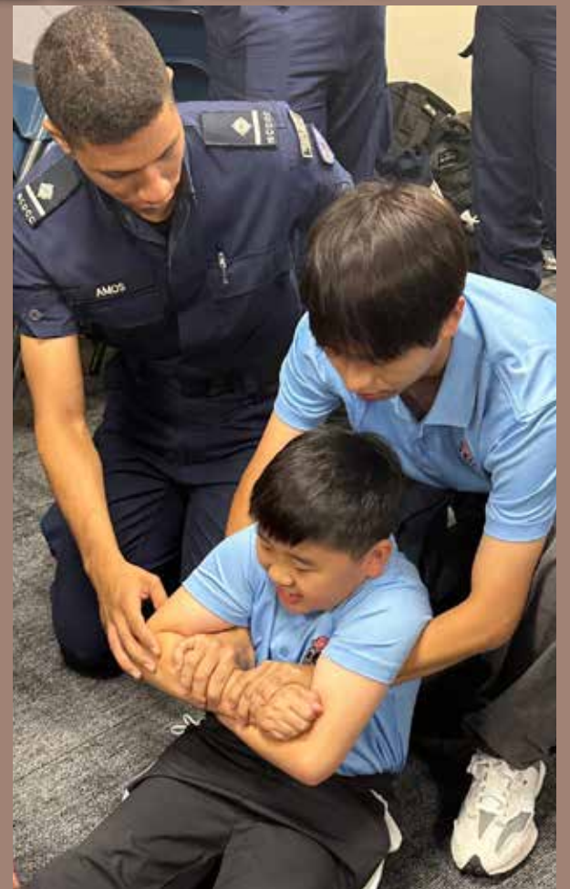
學習新加坡民防技術