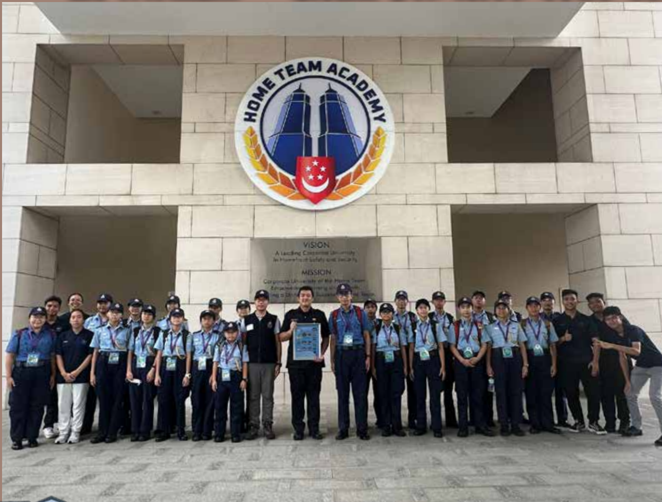
民安隊少年團參觀 Home Team Academy