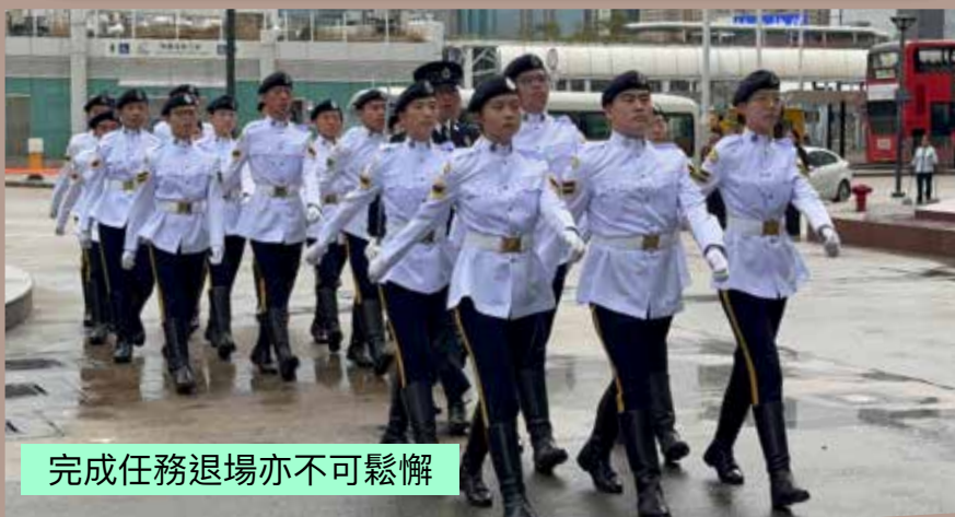
完成任務退場亦不可鬆懈