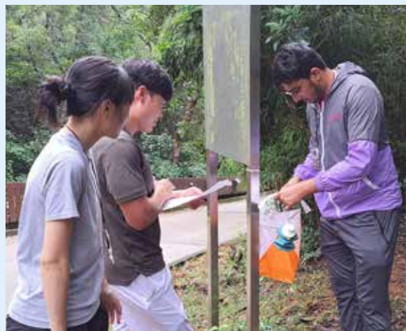
學生運用閱讀地圖技巧完成定向活動的任務

「民盡其才」 計劃旨在為青少年提供課堂以外的知識，協助未來社會棟梁盡顯潛能，計劃自 2020 年推行至今已有過萬名學生受惠。社區教育組於 2024 年 11 月 2 日及 16 日，分別為香港專業進修學校和香港浸會大學舉辦山嶺搜救體驗活動，學生學會了閱讀地圖的技巧和山嶺搜救的基本知識，還參與了沿繩下降、山嶺搜索及野外急救等模擬任務，從而挑戰自我、加強團隊合作精神和增強解難能力。社區教育組會在未來繼續舉辦同類型活動，培育下一代成為自信、自律及善於溝通的公民。