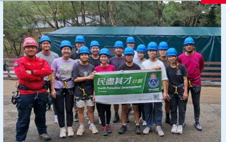
「民盡其才」計劃導師與香港浸會大學的學生合影留念

「民盡其才」 計劃旨在為青少年提供課堂以外的知識，協助未來社會棟梁盡顯潛能，計劃自 2020 年推行至今已有過萬名學生受惠。社區教育組於 2024 年 11 月 2 日及 16 日，分別為香港專業進修學校和香港浸會大學舉辦山嶺搜救體驗活動，學生學會了閱讀地圖的技巧和山嶺搜救的基本知識，還參與了沿繩下降、山嶺搜索及野外急救等模擬任務，從而挑戰自我、加強團隊合作精神和增強解難能力。社區教育組會在未來繼續舉辦同類型活動，培育下一代成為自信、自律及善於溝通的公民。