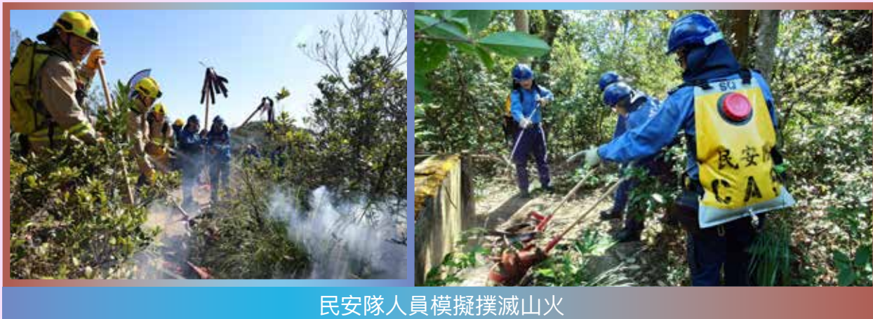
民安隊人員模擬撲滅山火

民安隊與多個政府部門於 2024 年 11 月 29 日在城門水塘一帶進行跨部門山火暨攀山拯救行動演習。是次演習模擬有大批行山人士郊遊時遇到山火，沿行山徑逃離時跌傷及燒傷。民安隊共派出超過 40 名長官及隊員參與，負責撲滅山火及山嶺搜救行動。