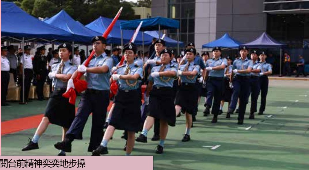
少年團儀仗隊在檢閱台前精神奕奕地步操

民安隊 步操比賽 2024 於 11 月 24 日上午在總部順利舉行。是次共有 27 支隊伍參賽，比賽項目包括團隊步操、升旗儀式及個人步操技巧。頒獎典禮於當日下午舉行，由保安局副局長卓孝業擔任主禮嘉賓。