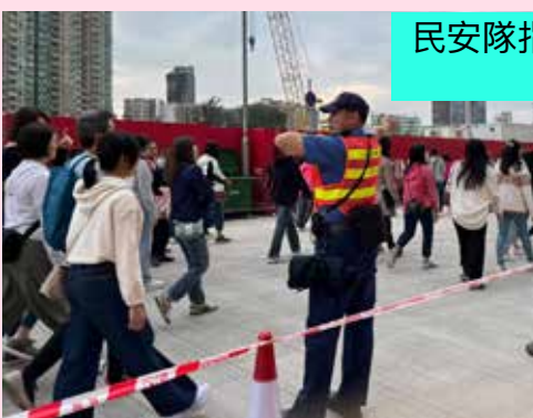
民安隊指示壓力測試人群往正確方向行走

這一系列的測試賽活動，不僅檢驗了場地及設施的準備情況，更展示了民安隊在大型活動中的高效協作與管理能力。