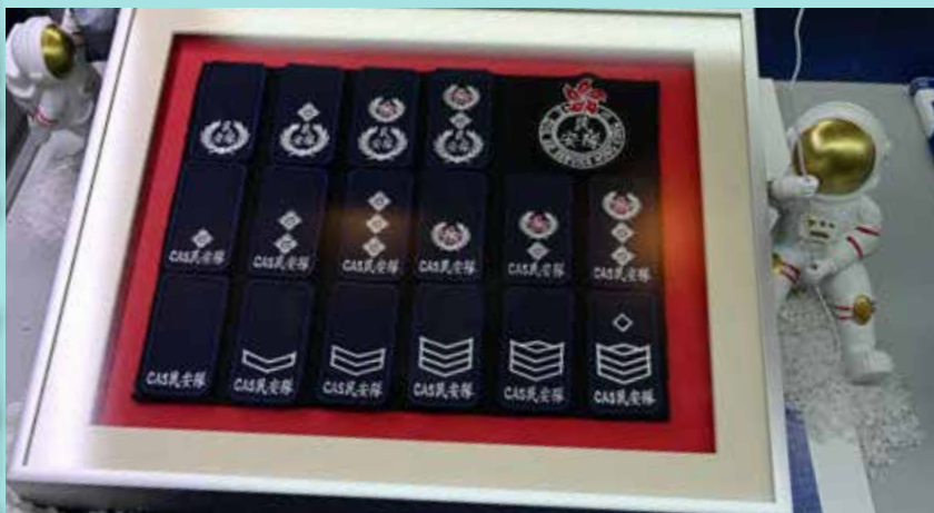
隨衛星升空的民安隊部隊肩章